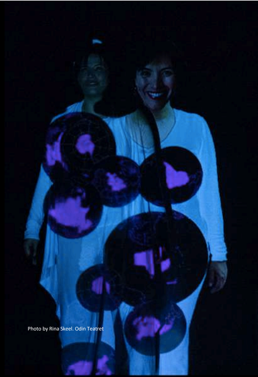
Odin Teatret