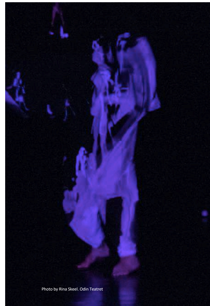
Odin Teatret