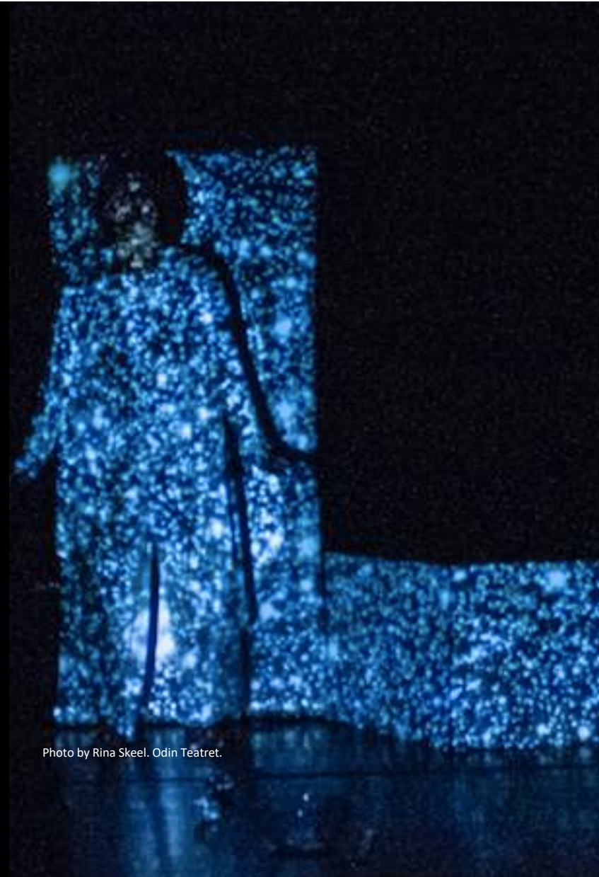
Odin Teatret.